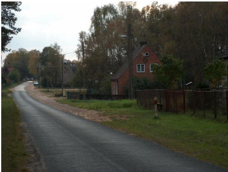
zdjęcie nr 4 *

Przez teren miejscowości Zatom przebiegają następujące drogi: