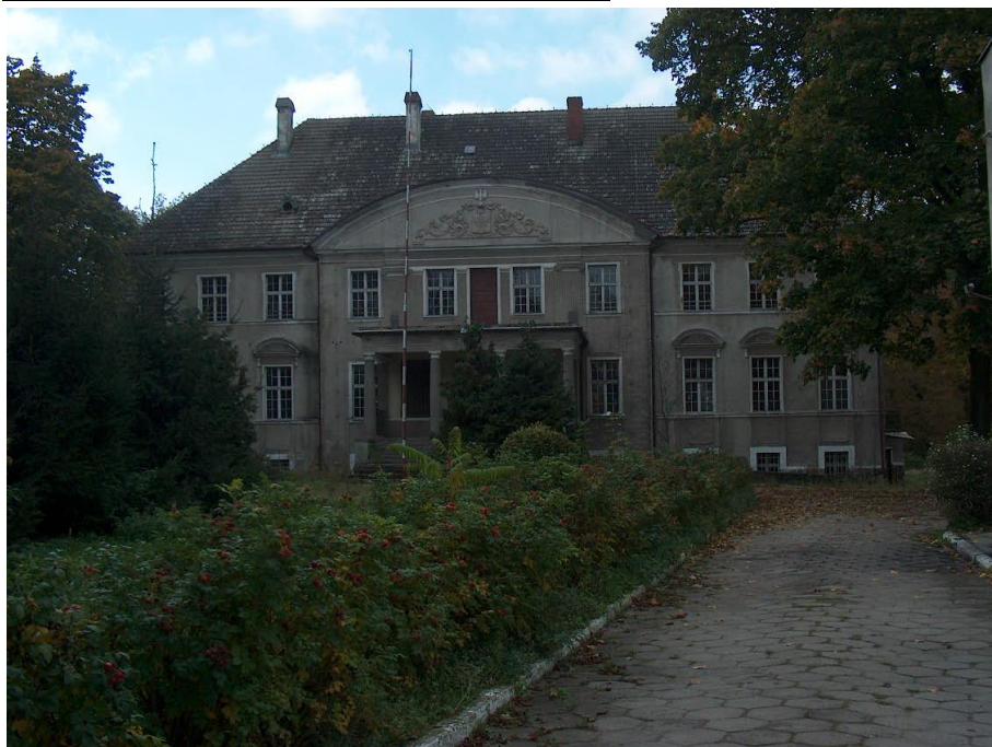
Pałac w Święciechowie – widok od strony parku