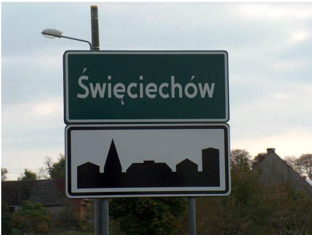
zdjęcie nr 1*