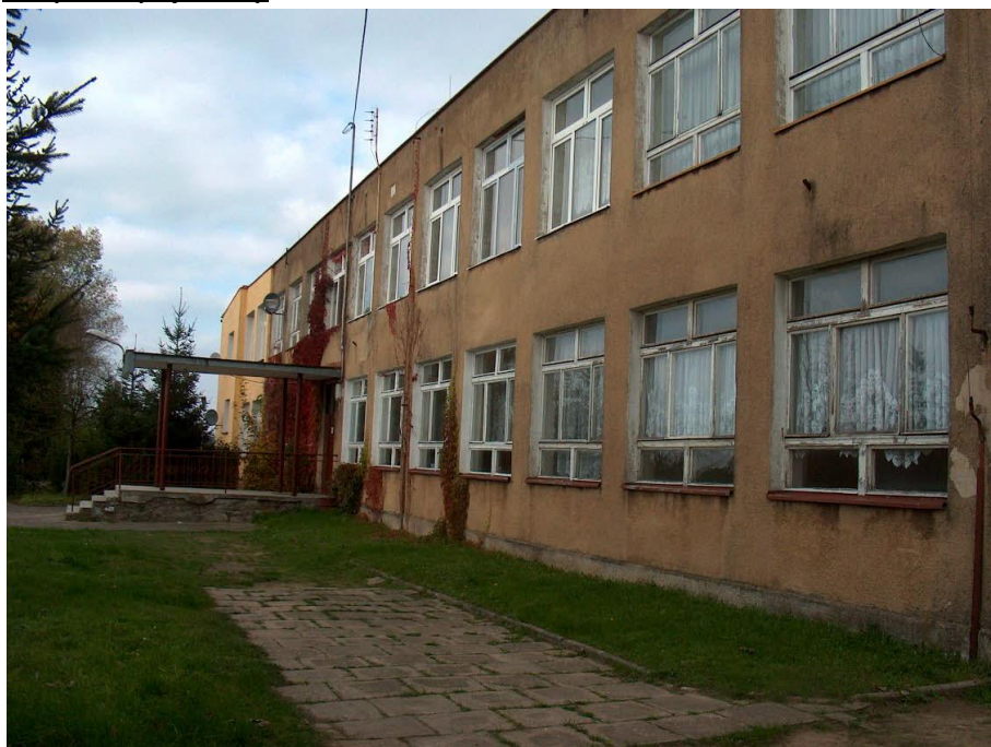
zdjęcie nr 5 *

Na terenie miejscowości Święciechów brak jest obiektów oświaty. Dzieci dojeżdżają do Szkół zlokalizowanych na terenie miejscowości Drawno. Dotyczy to także biblioteki która zlokalizowana jest w Drawnie.