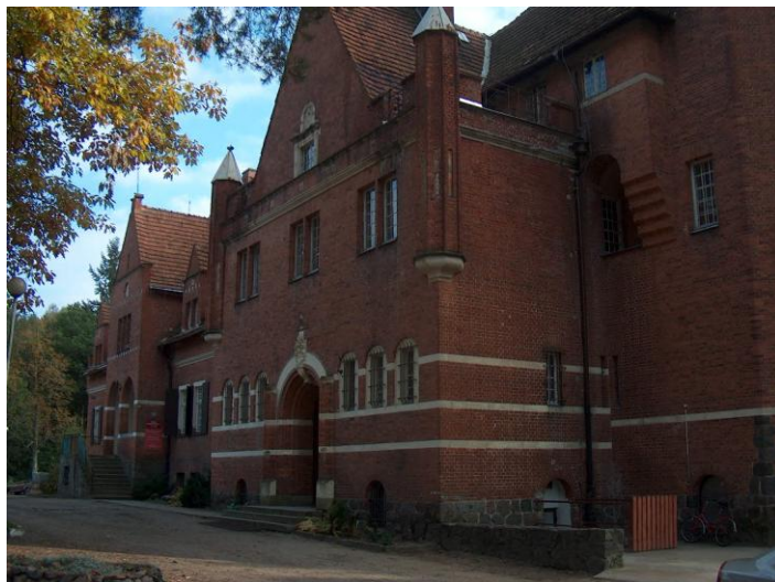
zdjęcie nr 5 i 6 *

Oprócz wskazanych wyżej placówek na terenie gminy funkcjonuje także niezależnie od gminy- podległa starostwu placówka: Ośrodek Szkolno Wychowawczy w Niemieńsku dla osób niepełnosprawnych , oraz oświatowa placówka niepubliczna, zajmująca się pozaszkolnym kształceniem ustawicznym w zakresie języków obcych.