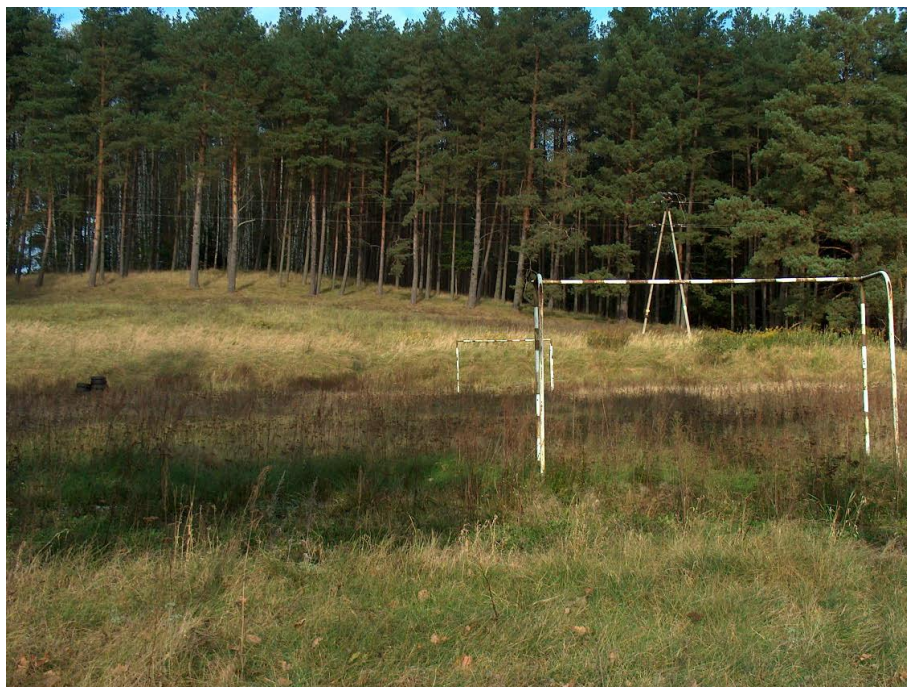
zdjęcie nr 8 *

Posiadanie przez wieś zadbanego boiska i trybun, pozwoli organizować imprezy o charakterze masowym, takie jak festyny, czy też spartakiady dzieci i młodzieży.