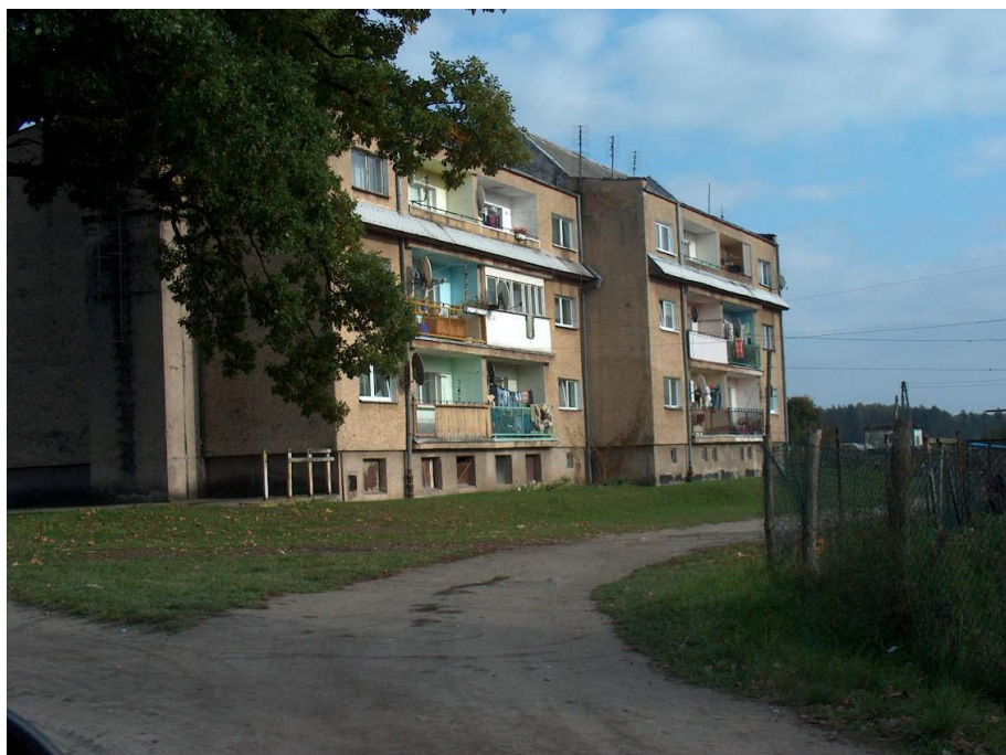
zdjęcie nr 4 *

Na zróżnicowanie zawodowe w dużym stopniu wpływa również poziom wykształcenia. Należy nadmienić, iż społeczność lokalna wykazuje wysoką aktywność na rynku pracy, tłumioną jednak przez czynniki strukturalne. Coraz liczniej reprezentowani są również prywatni przedsiębiorcy prowadzący działalność na własny rachunek. Niestety przybywa i bezrobotnych.