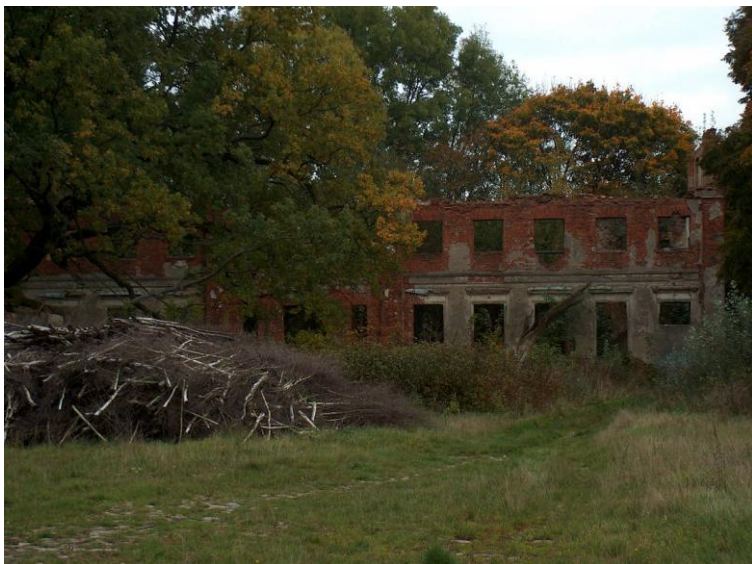
zdjęcie nr 2.*

Należało do niego 1140,7 ha. W skład majątku wchodziły jeszcze Buchtal ((2 domy - 19 osób), Idashain [83.4] - pd od Konotopu [nie istnieje] (2 domy - 37 osób) i Knochenmuhle -Kościany Młyn ob. L. Międzybórz=Walnik [147] 1 dom - 1 osoba). Cały majątek zamieszkiwały 272 osoby (136 mężczyzn i 136 kobiet, 266 ewangelików, 6 katolików, kościół ewangelicki był w Barnimiu). Była cegielnia w XIX w. na pn-zach. przy drodze do Barnimia.