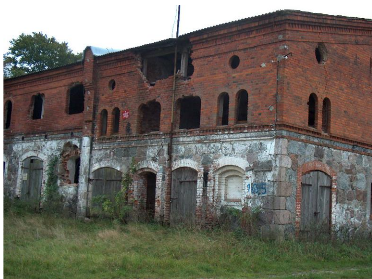
zdjęcie nr 3*

W 1928 r. reszta majątku (Ritergut) należała do baronowej von Klot-Trautvetter, zarządzał nią Sarrazin mieszkający w rządówce (Inspektorhaus). Majątek liczył 598,2 ha: w tym 414,4 ha gruntów ornych, 39,8 ha łąk, 130 ha lasy, 5 ha nieużytki, 8,6 ha wody. Prowadzono hodowlę 35 koni, 232 sztuk bydła (w tym 174 krów) i 135 sztuk świń .