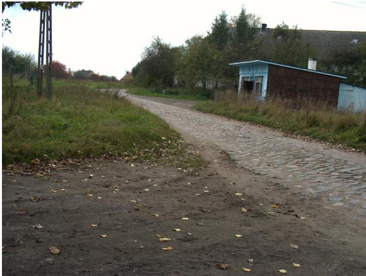
zdjęcie nr 5 *

Ponadto komunikację PKP zapewnia jedyna czynna linia kolejowa relacji Stargard Szcz -Prostynia- Kalisz Pomorski.