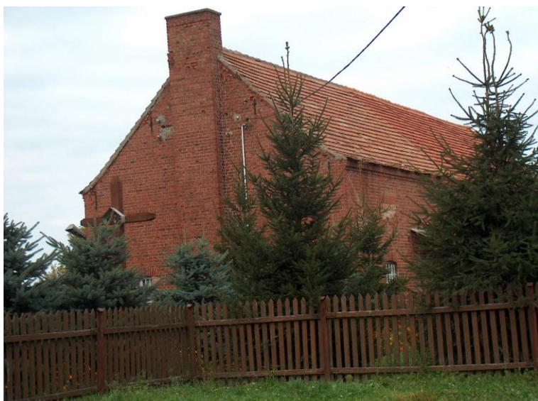
zdjęcie nr 4 *

Na terenie Konotopia brak jest obiektu oświatowego – także biblioteki. Istnieje ona w Drawnie. W skład materiałów informacyjnych wchodzi: księgozbiór, płyty CD, broszury, ulotki, plakaty. Biblioteka ta współpracuje ze Szkołami w Dawnie oraz instytucjami pozarządowymi organizując między innymi „Pasowanie Czytelnika” i wieczory „Poezji Dziecięcej”.