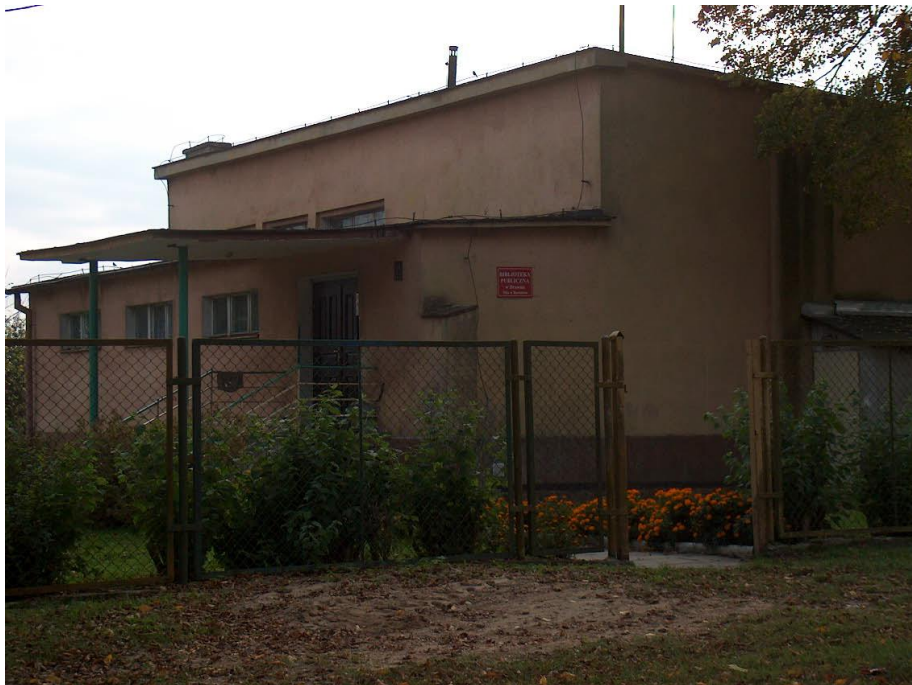
zdjęcie nr 5 *

Mieszkańcy objęci są od wielu lat opieką medyczną z ramienia przychodni zdrowia – dziś Niepublicznego Zakładu Opieki Zdrowotnej ESKULAP. Mieszkańcy Barnimia mogą liczyć w nim na pomoc medyczną lekarzy o różnych specjalnościach. Usługi świadczone są w zakresie lekarza rodzinnego, usług stomatologicznych, pielęgniarstwa, poradni „K” a także wykonywane są w razie potrzeby wizyty domowe.