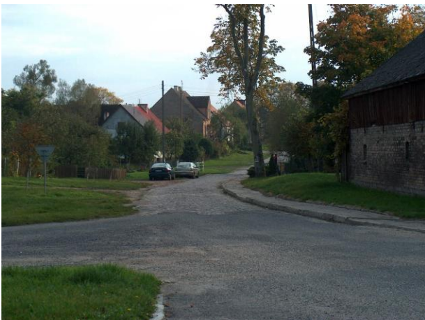
zdjęcie nr 8 i 9 *

Gmina Drawno położona jest w południowej części województwa zachodniopomorskiego, w powiecie choszczeńskim, na zachodnim skraju Puszczy Drawskiej, na pograniczu Pojezierza Myśliborskiego i Wałeckiego. Powiązania z terenami województwa i kraju zapewniają drogi wojewódzkie i powiatowe stanowiące szkielet układu drogowego, w tym: drogi wojewódzkie – 16,4 km, drogi powiatowe – 91,422 km. oraz drogi gminne o długości 50,094 km.