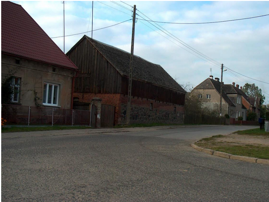
zdjęcie nr 3*

Budynki gospodarcze konstrukcji szkieletowej i ceglanej w połączeniu z drewnem w przeszłości kryte trzcina, słomą lub dachówką, obecnie eternitem falistym. Z zabudowy wyróżnia się dom w południowo-wschodniej części wsi z 1909 roku z inicjałami "E. W.", ryzalitem pozornym od frontu zwieńczonym wystawką o wolutowych spływach. Obok obiektu szczytem do drogi stoi drewniana stodoła. Na uwagę wśród XIX wiecznej zabudowy oraz z 1 ćw.XX w. zasługuje jeszcze dom Nr 26 w środku wsi — naprzeciwko drogi z kolonii Barnimie. Za Drawą na wyniesieniu po południowej stronie nowa zabudowa leśnictwa.