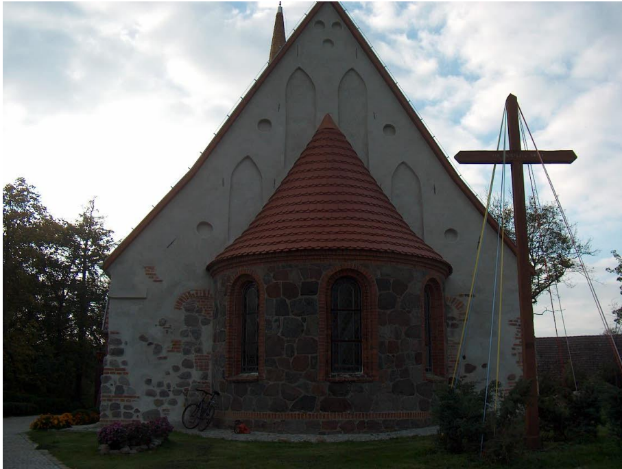
zdjęcie nr 4 *