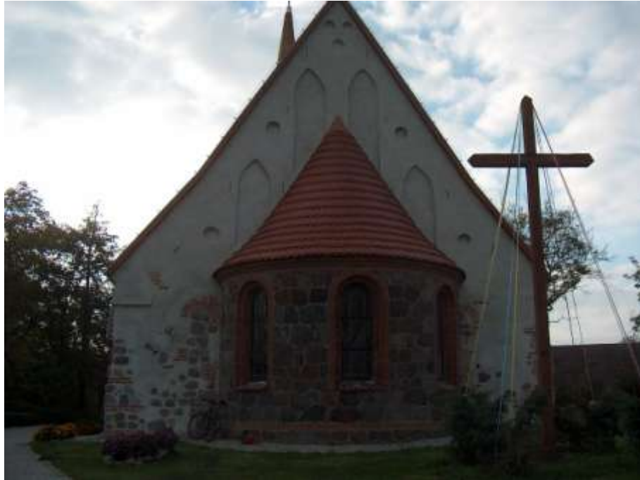
zdjęcie nr 4 *