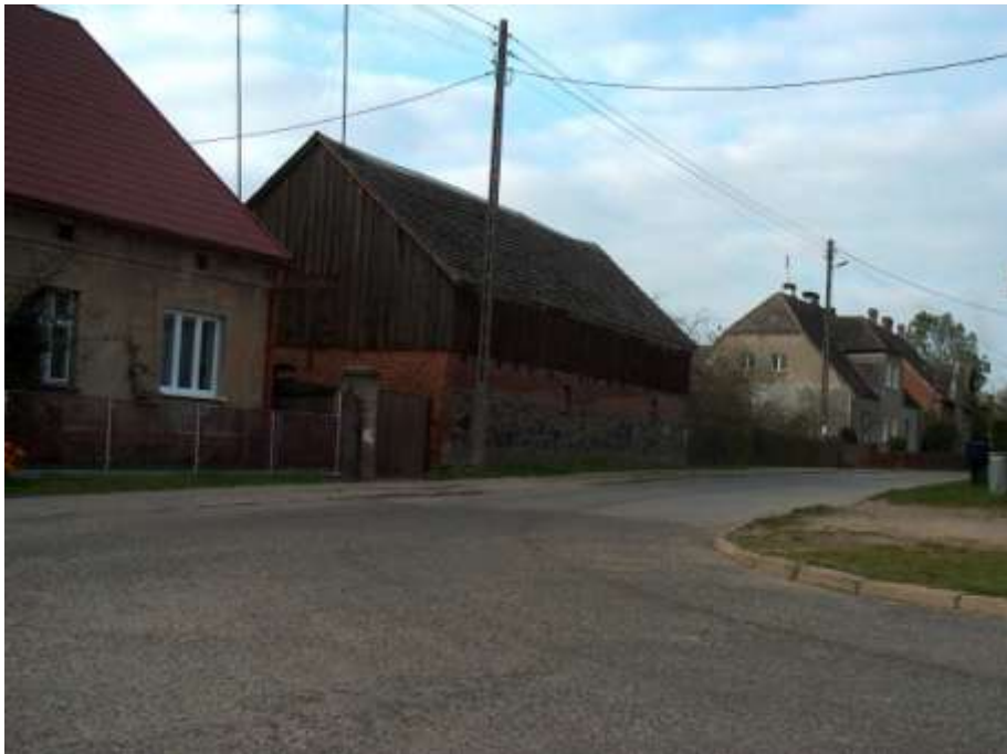
zdjęcie nr 3*

Budynki gospodarcze konstrukcji szkieletowej i ceglanej w połączeniu z drewnem w przeszłości kryte trzcina, słomą lub dachówką, obecnie eternitem falistym. Z zabudowy wyróżnia się dom w południowo-wschodniej części wsi z 1909 roku z inicjałami "E. W.", ryzalitem pozornym od frontu zwieńczonym wystawką o wolutowych spływach. Obok obiektu szczytem do drogi stoi drewniana stodoła. Na uwagę wśród XIX wiecznej zabudowy oraz z 1 ćw.XX w. zasługuje jeszcze dom Nr 26 w środku wsi — naprzeciwko drogi z kolonii Barnimie. Za Drawą na wyniesieniu po południowej stronie nowa zabudowa leśnictwa.