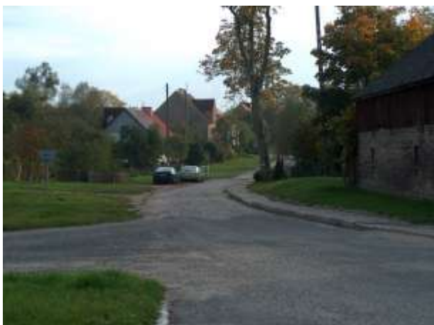
zdjęcie nr 8 i 9 *

Gmina Drawno położona jest w południowej części województwa zachodniopomorskiego, w powiecie choszczeńskim, na zachodnim skraju Puszczy Drawskiej, na pograniczu Pojezierza Myśliborskiego i Wałeckiego. Powiązania z terenami województwa i kraju zapewniają drogi wojewódzkie i powiatowe stanowiące szkielet układu drogowego, w tym: drogi wojewódzkie – 16,4 km, drogi powiatowe – 91,422 km. oraz drogi gminne o długości 50,094 km.