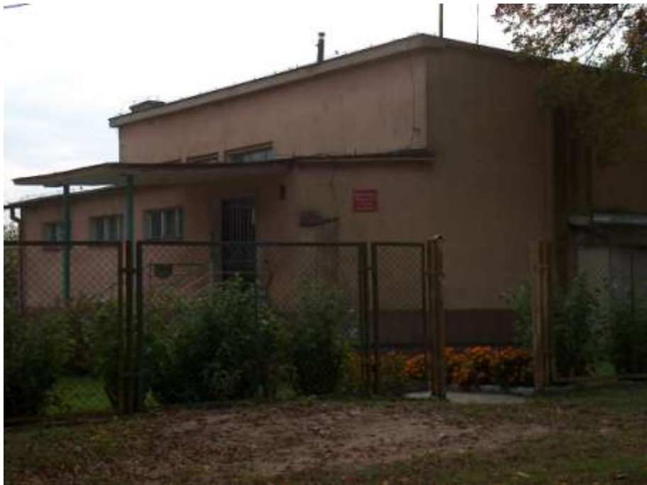
zdjęcie nr 5 *

Mieszkańcy objęci są od wielu lat opieką medyczną z ramienia przychodni zdrowia – dziś Niepublicznego Zakładu Opieki Zdrowotnej ESKULAP. Mieszkańcy Barnimia mogą liczyć w nim na pomoc medyczną lekarzy o różnych specjalnościach. Usługi świadczone są w zakresie lekarza rodzinnego, usług stomatologicznych, pielęgniarstwa, poradni „K” a także wykonywane są w razie potrzeby wizyty domowe.