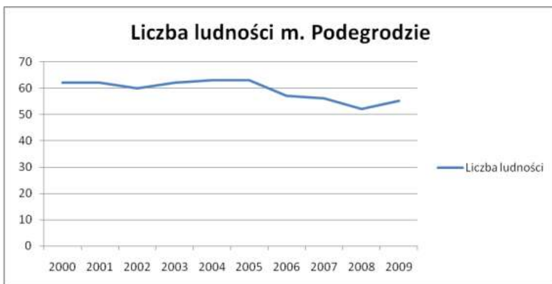
Tabela przedstawia liczbę ludności miejscowości Podegrodzie w przeciągu ostatnich 10 lat.

źródło danych: dane uzyskane od Gminy Drawno