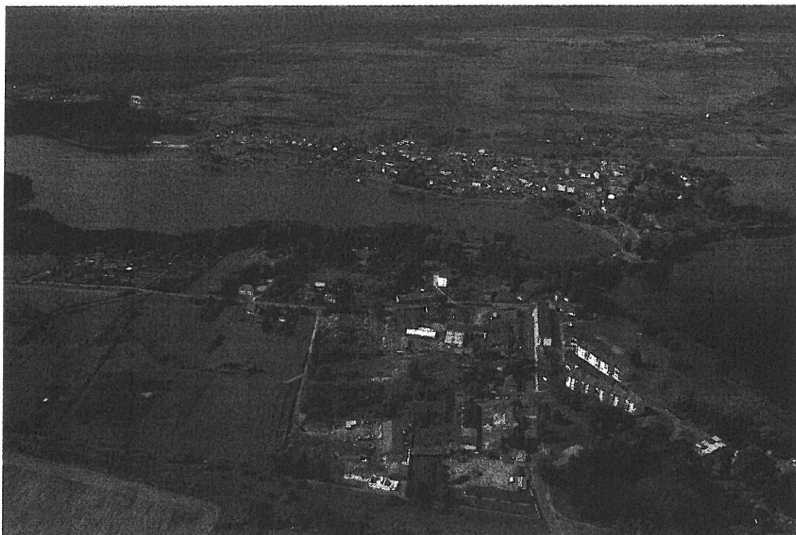
Drawno na przesmyku jezior Grażyna i Adamowo