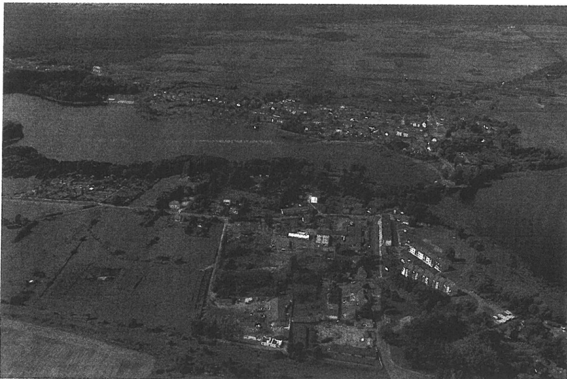
Drawno na przesmyku jezior Grażyna i Adamowo