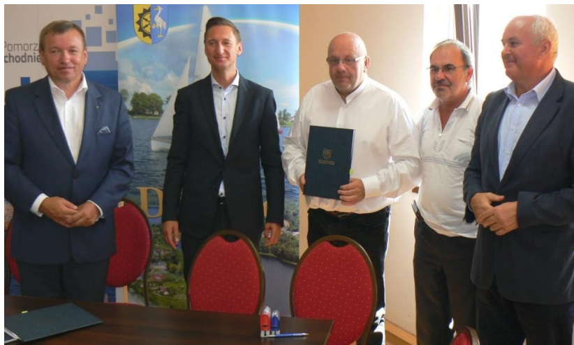
Zdj. Posiedzenie Zarządu Województwa Zachodniopomorskiego w Drawnie, podpisanie umowy przez LOT.

„ZAPROŚ NAS DO SIEBIE” . W ramach Projektu „Zaproś nas do siebie” pod patronatem Narodowego Centrum Kultury, w DOK odbyły się trzy spotkania, w trakcie których zespół społeczników składający się z przedstawicieli organizacji pozarządowych, Gminy Drawno, placówek oświatowych, Biblioteki Publicznej w Drawnie, Środowiskowego Domu Samopomocy w Drawnie, Drawieńskiego Parku Narodowego oraz sołtysów przygotowywał strategię rozwoju Drawieńskiego Ośrodka Kultury.