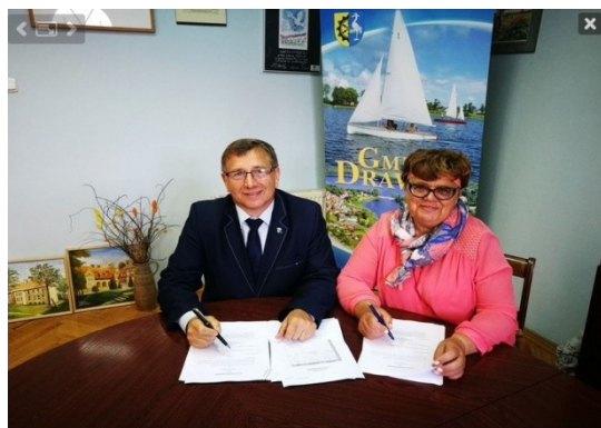
Zdj. Podpisanie umowy- założenie Spółdzielni

REWITALIZACJA SPOŁECZNA. W ramach projektu „Rewitalizacja na terenie gmin województwa zachodniopomorskiego znajdujących się w Specjalnej Strefie Włączenia”, w którym partnerem była Gmina Drawno powstały wiaty w Konotopiu i Niemieńsku służące mieszkańcom jako miejsca spotkań i integracji oraz siłownie zewnętrzne w Chomętowie i Świąciechowie. Operatorem tych inicjatyw było Stowarzyszenie Ludzi Bezrobotnych. W działania byli zaangażowani również mieszkańcy tych miejscowości.