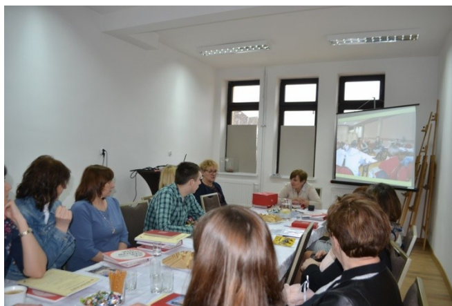
Zdj. Spotkanie podsumowujące Projekt „Zaproś nas do siebie”.

„ZAPROŚ NAS DO SIEBIE” . W ramach Projektu „Zaproś nas do siebie” pod patronatem Narodowego Centrum Kultury, w DOK odbyły się trzy spotkania, w trakcie których zespół społeczników składający się z przedstawicieli organizacji pozarządowych, Gminy Drawno, placówek oświatowych, Biblioteki Publicznej w Drawnie, Środowiskowego Domu Samopomocy w Drawnie, Drawieńskiego Parku Narodowego oraz sołtysów przygotowywał strategię rozwoju Drawieńskiego Ośrodka Kultury.