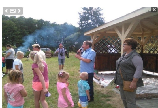
Zdj. Wiata w Niemieńsku.