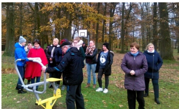
Zdj. Siłownie zewnętrzne w Chomętowie.

REWITALIZACJA SPOŁECZNA. W ramach projektu „Rewitalizacja na terenie gmin województwa zachodniopomorskiego znajdujących się w Specjalnej Strefie Włączenia”, w którym partnerem była Gmina Drawno powstały wiaty w Konotopiu i Niemieńsku służące mieszkańcom jako miejsca spotkań i integracji oraz siłownie zewnętrzne w Chomętowie i Świąciechowie. Operatorem tych inicjatyw było Stowarzyszenie Ludzi Bezrobotnych. W działania byli zaangażowani również mieszkańcy tych miejscowości.