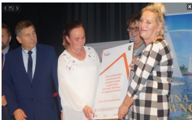
Zdj. Tablica upamiętniająca założenie Spółdzielni

Rok 2017 był szczególny pod względem aktywnej współpracy Gminy Drawno z organizacjami pozarządowymi. Miedzy innymi dlatego, że wspólne działanie jednostki samorządowej i Stowarzyszenia Ludzi Bezrobotnych zaowocowało powstaniem Spółdzielni Socjalnej „NAD DRAWĄ”, której celem strategicznym jest reintegracja społeczna i zawodowa osób zagrożonych wykluczeniem społecznym.