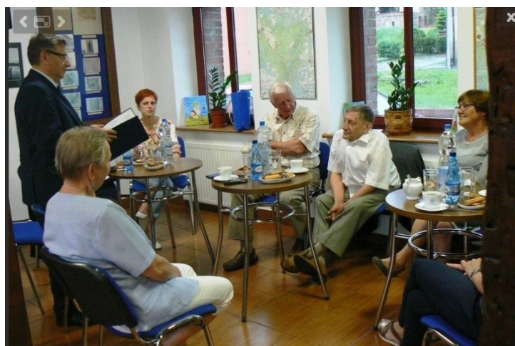
Zdj. Spotkanie Gminnej Rady Seniorów

GMINNA RADA SENIORÓW została powołana pod koniec 2016 r. W 2017 r. opracowywana była Mała strategia na rzecz seniorów, konsultowana również z organizacjami pozarządowymi. Wszystkie działania Rady zamieszczane są na stronie internetowej Drawna. Obecnie siedziba Rady znajduje się w Spichlerzu.