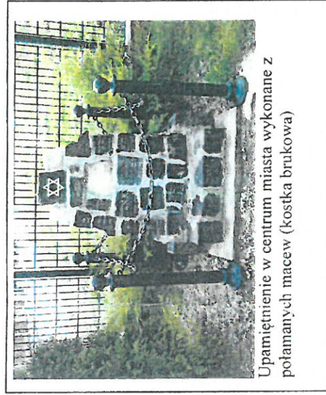
Upamiętnienie w centrum miasta wykonane z potamanych macew (kostka brukowa)